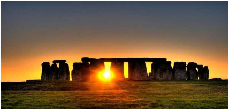
Stonehenge. Inglaterra.