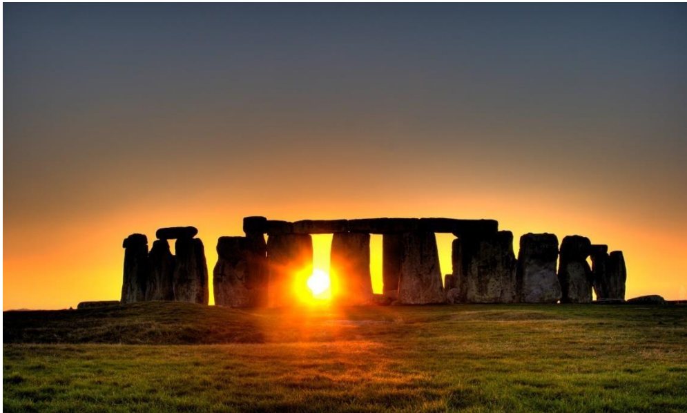
Stonehenge. Inglaterra.